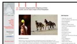
Association Suisse des Banques d'Images et Archives Photographiques ( ASBI ) http://www.sab-photo.ch/