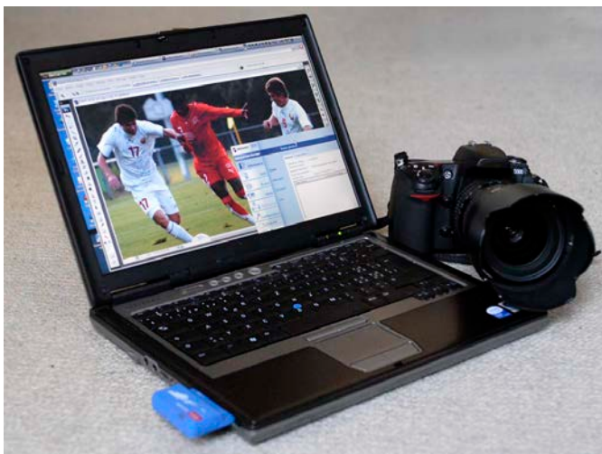
Envoi des photos numériques avec un ordinateur portable via un réseau sans fil.

Ringier a un contrat avec Corbis et la diffuse en Suisse (chez certains éditeurs). Reuters diffuse l'international et s'appuie sur un réseau de photographes indépendants en Suisse. Elle a aussi un accord commercial avec Getty.